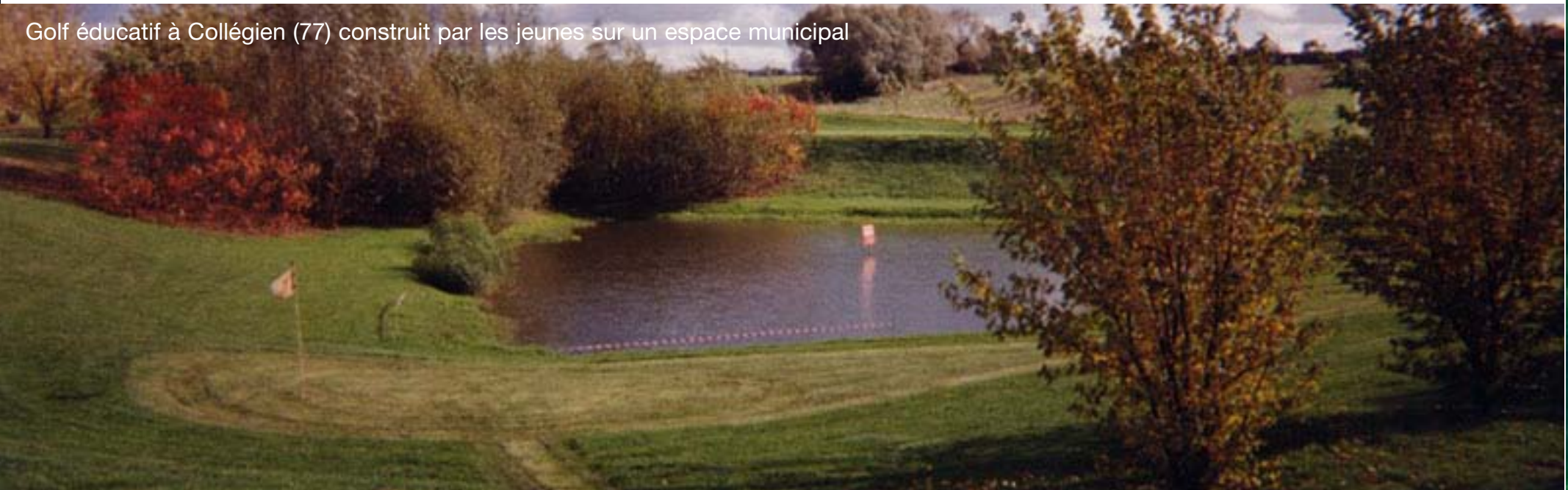
Golf éducatif à Collégien (77) construit par les jeunes sur un espace municipal

Après des années de tests, d'expérimentations et d'évaluations dans les milieux socio-éducatifs, l'Association pour le Golf Educatif. gagne la confiance des Ministères de la Jeunesse et des Sports, de l'Éducation Nationale, de l'Intérieur et de la Défense, mais aussi celle de la FFG (Fédération Française de Golf) et de la PGA (Association des Professionnels de Golf ) France et UK.