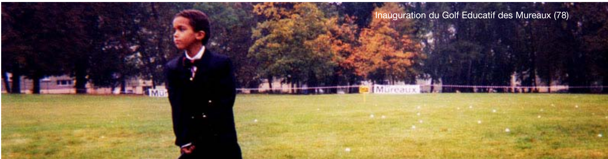
Inauguration du Golf Educatif des Mureaux (78)

Certaines écoles ont ainsi inscrit le «golf éducatif» dans leur programme d'éducation physique et sportive en partenariat avec le Ministère de l'Education Nationale.